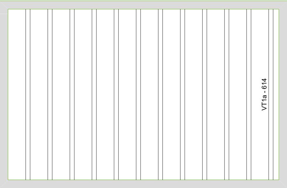
PLANTA DE VIGOTAS PRÉ-MOLDADAS - PLATIBANDA