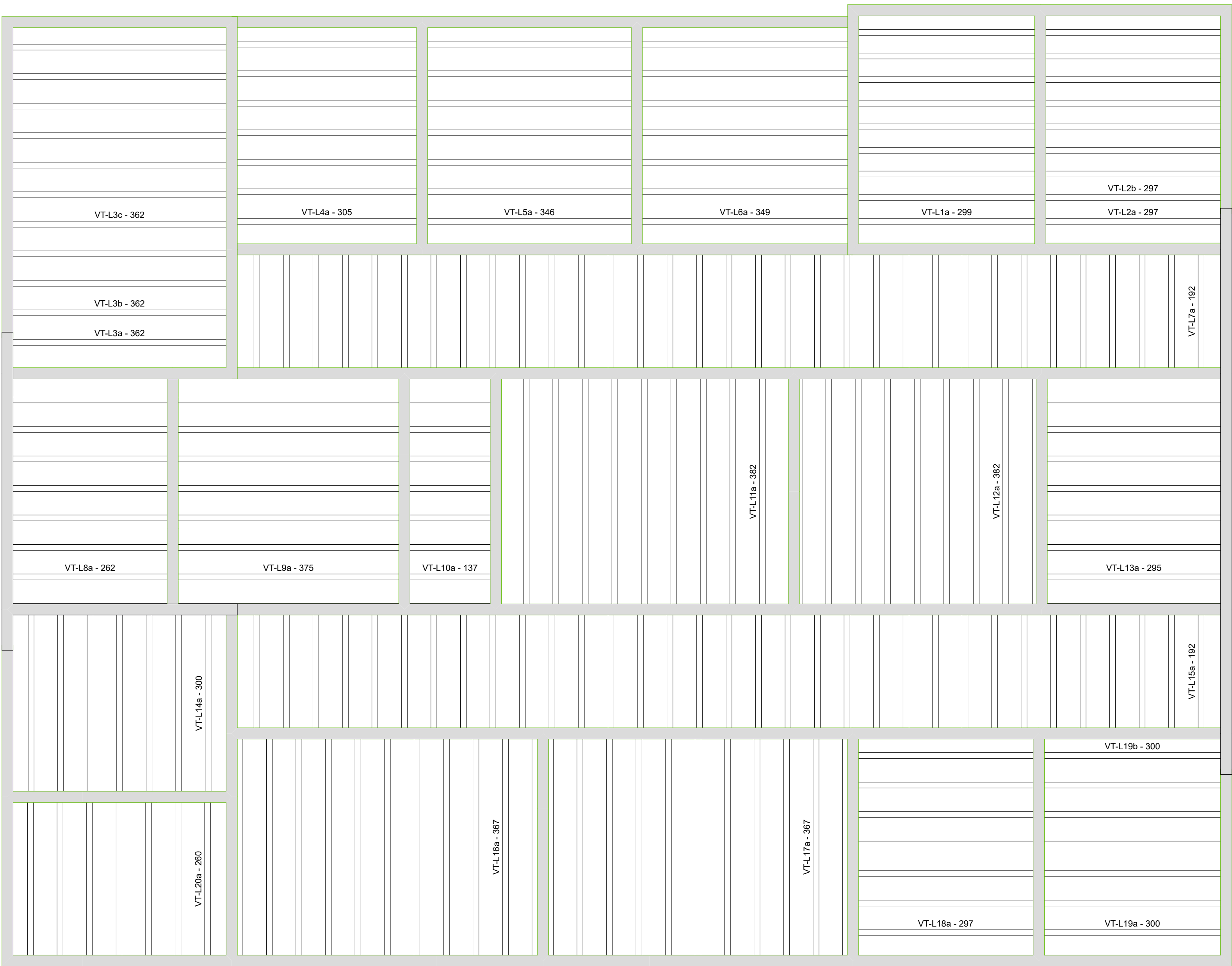
PLANTA DE VIGOTAS PRÉ-MOLDADAS - TÉRREO

RELAÇÃO DO AÇO Volume de concreto (C-25) = 17,99 m³ Área de forma = 0,00 m²